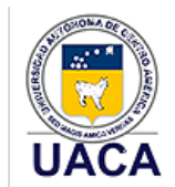
Universidad Autónoma de Centro América (Costa Rica)