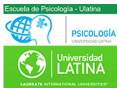
Escuela de Psicología. Ulatina (Costa Rica)