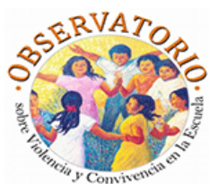
Observatorio Sobre la Violencia y Convivencia en la Escuela (Perú)